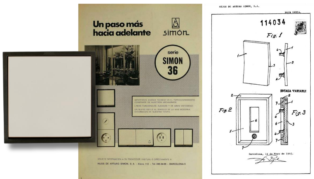
Simon 36, serie lanzada en 1971. Junto con anuncio publicado en Revista de Aparejadores y Modelo de Utilidad firmado en 1968.

Simon , compañía líder en material eléctrico y referente en diseño de iluminación, sistemas de control y conectividad, presenta al mercado la serie Simon 360 , uno de sus lanzamientos más importantes de los últimos años. Se trata de una propuesta revolucionaria que no es solo una reedición, sino una reafirmación de su histórica serie Simon 36 . Originalmente conceptualizada en 1965 y comercializada en 1971, la S36 rompió moldes al ser la primera serie con tecla grande en España, demostrando que los interruptores podían ser objetos de diseño. Hoy, Simon 360 revive este icono industrial preservando su esencia y sumando innovaciones para el bienestar de las personas.